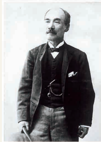
Saihei Hirose Primeiro Diretor-Geral da Sumitomo