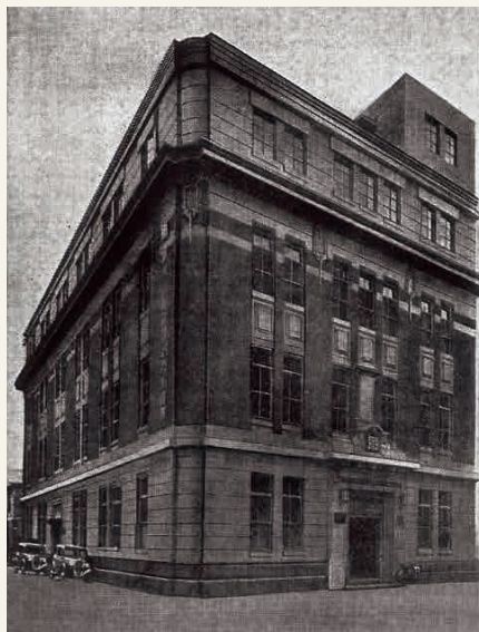
El anexo del edificio de Sumitomo, donde estaba ubicada la oficina central de Nippon Engineering