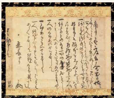
Monjuin Shiigaki

Los preceptos también incluyen doctrinas de enseñanza tales como las siguientes: “Cuando los productos se te ofrecen por debajo del precio normal del mercado, bajo ninguna circunstancia debes comprar dichos productos, es muy probable que su origen sea desconocido y que hayan sido robados”, “Nunca des albergue a un extraño, no importa quién pueda ser; del mismo modo, nunca tomes bajo custodia los objetos de un extraño, sin importar que tan insignificantes puedan parecer” (estos actos fueron prohibidos por el gobierno) y “Sin importar lo que alguien te pudiera decir, nunca pierdas el temperamento ni digas malas palabras; explica de forma educada tu posición hasta que se logre el entendimiento”. Estas enseñanzas han sido heredadas y forman la base del Espíritu empresarial de Sumitomo. En la actualidad se siguen tomando en cuenta estos principios, tal como, “no obtengas ganancias fáciles” (es decir, obtener utilidades solamente en una transacción de precio justo que pueda explicarse con confianza), “cumplimiento” y “gestión de integridad y firme gestión”.