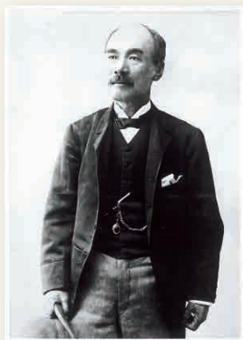
住友家第一代总理事 广濑 宰平